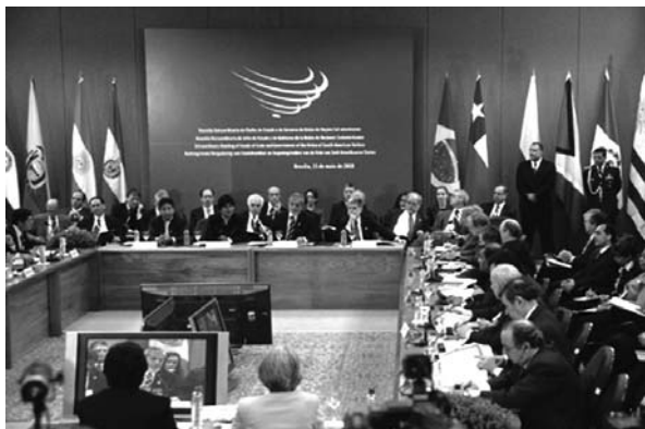
Cumbre de Jefes de Estado y de Gobierno del Grupo de Río

Eduardo Grüner, La oscuridad y las luces , 2008