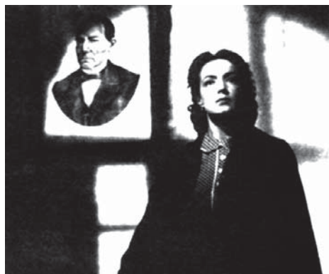
Río Escondido, 1945, Emilio "el Indio" Fernández.

Carlos Monsivais, "Las mitologías del cine mexicano"; Objeto visual , 1; Caracas, 1993.