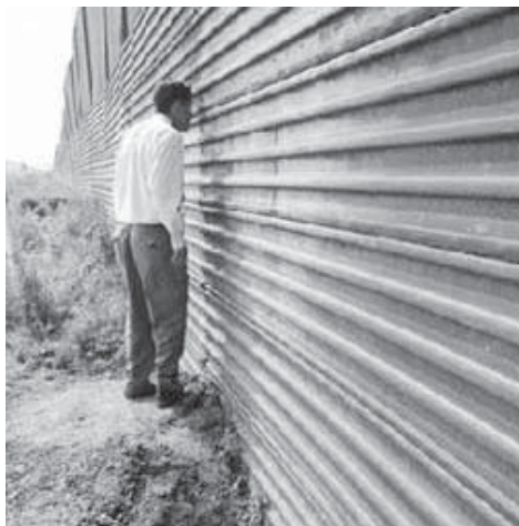
Alan Knight, Cartografiar el cambio , 2006.

Gloria Anzaldúa, Borderlands/La frontera , 1987.