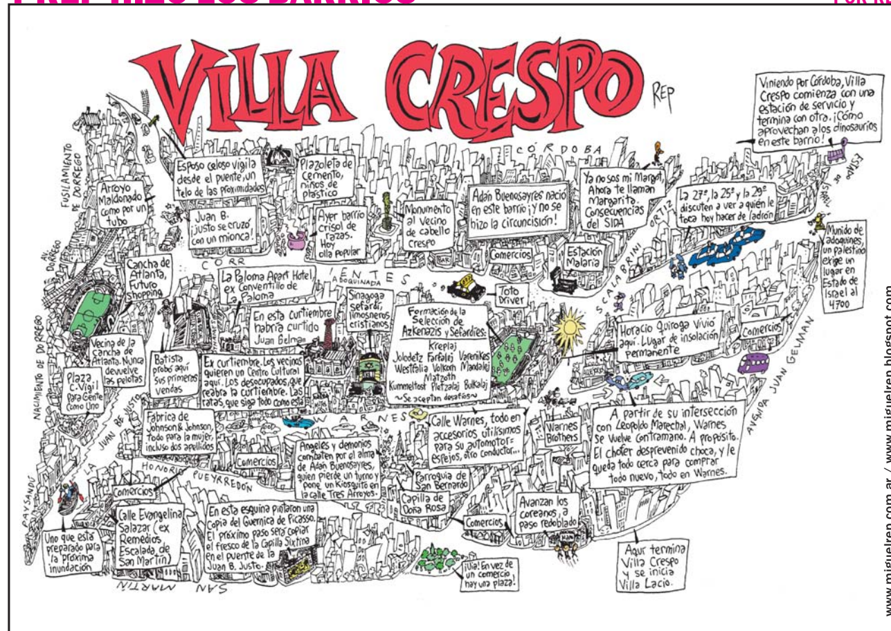
www.miguelrep.com.ar / www.miguelrep.blogspot.com

Música sin Límites. Espectáculos organizados por la Dirección General de Música del Ministerio de Cultura de la Ciudad. CINE Y MÚSICA EN LAS VENAS. Estudio Urbano invita a disfrutar de películas en las que el ingrediente musical es el principal protagonista y que tienen, además, la virtud de ser cinematográficamente bellas. Además, se verán algunos films de realizadores poco difundidos en el país, con estéticas ligadas a lo contracultural. Hoy, a las 19 hs. SÍ SÓS BRUJO. De Caroline Neal. Mañana, a las 19 hs. ARGENTINA BEAT. De Hernán Gaffet. Curapaligüe 585.