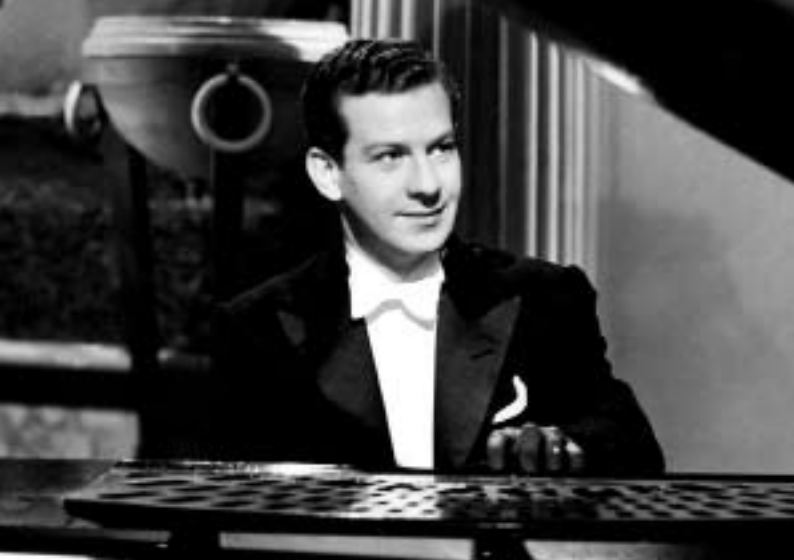
» Mariano Mores.

También habría lugar para Alberto Castillo, que llega de la radio y el disco con estilo inimitable y afinación perfecta. Y aunque la mayoría de sus films no le hicieron justicia, pueden recordarse algunas de sus grandes versiones. Así, en Adiós pampa mía (1946, M. Romero) entrega una versión conmovedora de La que murió en París , [...] repite aciertos en El tango vuelve a París (1948, M. Romero). La barra de la esquina (1950, J. Saraceni); Buenos Aires, mi tierra querida (1951, J. Saraceni).